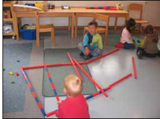
Die Stufenstangen dienen zur Wahrnehmung und Differenzierung unterschiedlicher Längen