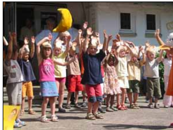
Auftritt beim örtlichen Verein