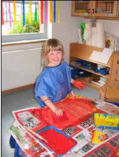
Projekt: Farben und Formen

Angebote finden im Gruppengeschehen oder in Kleingruppen statt. Wir möchten den Kindern Gelegenheiten bieten, selbständig, eigeninitiativ und kreativ zu arbeiten. Ziel der Angebote ist Interessen, Fähigkeiten und Talente zu wecken und zu fördern. Unbekanntes oder Neues wird vertraut gemacht. Dieses geschieht oftmals auch in Form von Projekten.