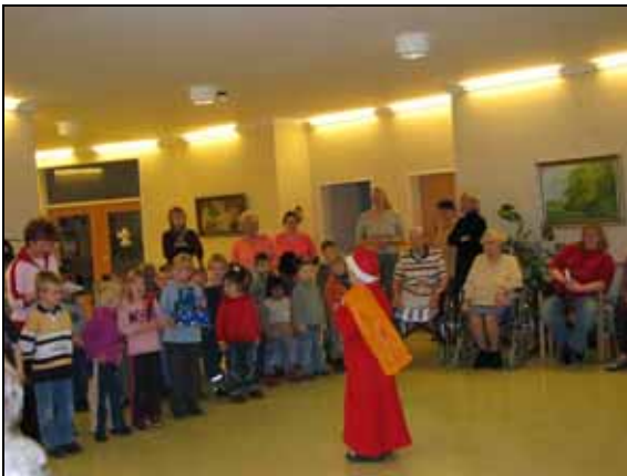
Nikolausbesuch Seniorenheim Holle

Feste sind Höhepunkte im menschlichen Zusammenleben. Sie sind Ausdruck von Kultur, Tradition und Brauchtum einer Gemeinschaft. Darum feiern wir Geburtstag, Fasching, Ostern, Laternenfest und die Nikolausfeier im Seniorenheim Holle. Außerdem nehmen wir an den örtlichen Veranstaltungen teil ( z. B. Weihnachtsmarkt / Kinderfest ).