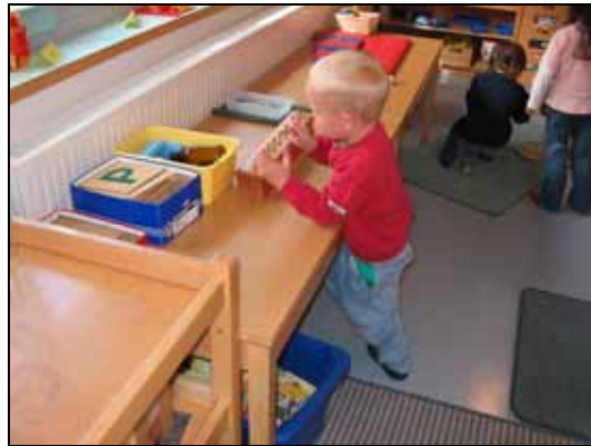
Beim Arbeiten mit den Zylinderblöcken werden Feinmotorik und das räumliche Denken geschult