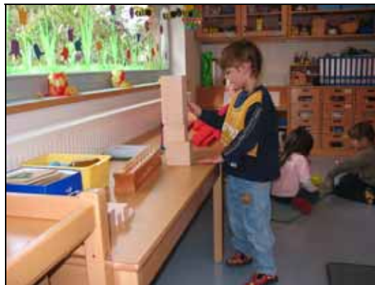
Beim spielen mit dem Würfelturm entwickeln Kinder ein Gefühl von Größenordnung und Geometrie